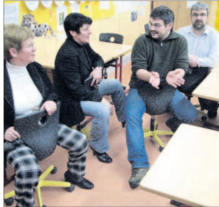
Mitglieder der Schule und des Schulausschusses sitzen Probe auf dem neuen Schülergestühl, auf dem man auch andersherum sitzen darf.

Nach einem Vortrag und Aktionstag zum Thema „Bewegte Schule. Gesundheitsprävention an niedersächsischen Grundschulen“ entschloss sich die Grundschule am Harztorwall, ein Klassenzimmer, das sowieso neu bestuhlt werden musste, mit Stühlen auszustatten,